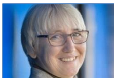
MUDr. Olga Sehnalová, MBA, poslankyně Evropského parlamentu